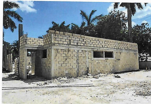
F4: Fachada posterior