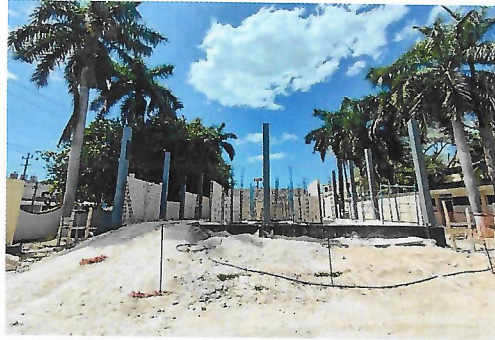
F1: Fachada principal