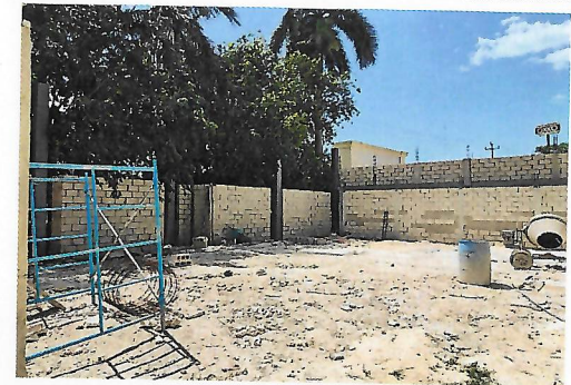
F5: Interior de auditorio