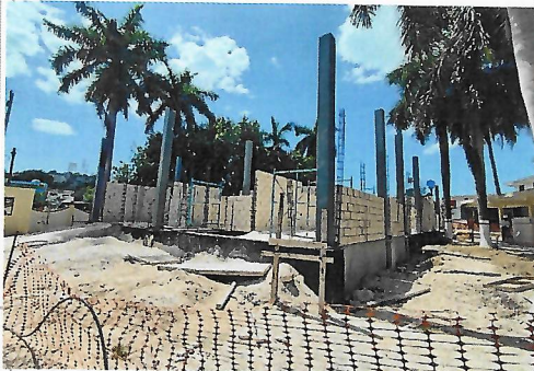
F3: Lateral 2