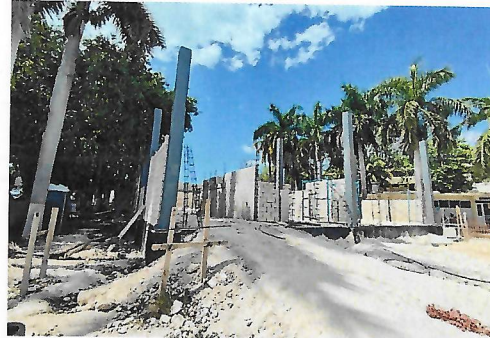
F2: Lateral 1